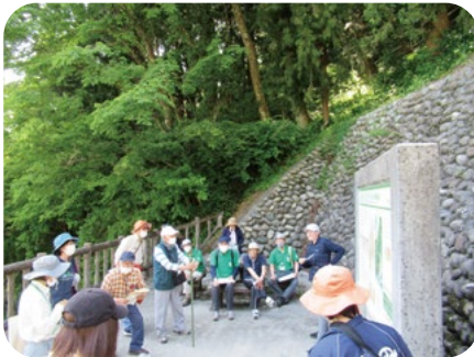
〈フォッサマグナパーク〉

コロナ禍も落ち着き、糸魚川ジオパークにも観光客が戻ってきています。さらなるレベルアップを目指して糸魚川ジオパーク観光ガイドとフォッサマグナミュージアム学芸員で、合同学習会を開催しています!